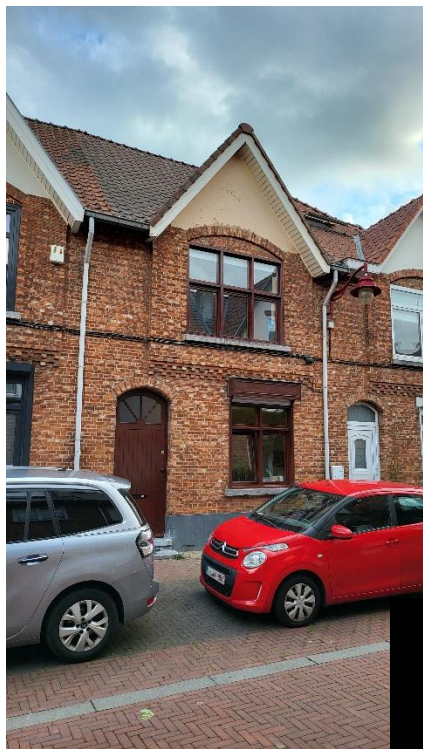
Figure 1 : Façade avant de la maison

Au rez-de-chaussée on retrouve les espaces communs tels que le séjour, la salle à manger et la cuisine. La maison est composée d'un volume principal auquel s'ajoute une véranda dans laquelle se trouve l'actuelle cuisine. L'espace de la véranda est fort séparé du reste du rez-de-chaussée.