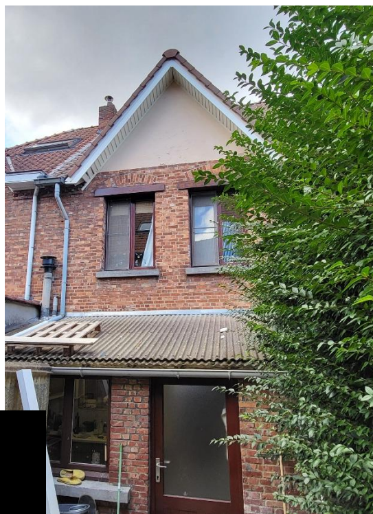
Figure 2 : Façade arrière de la maison